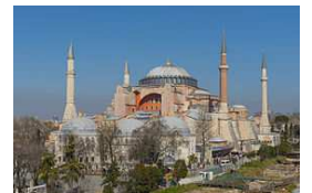
une église : Sainte-Sophie