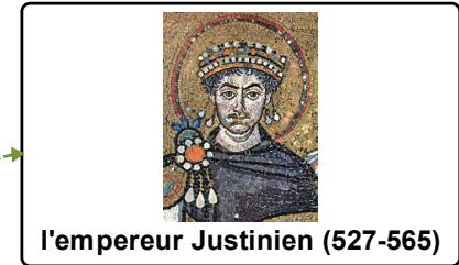
l'empereur Justinien (527-565)